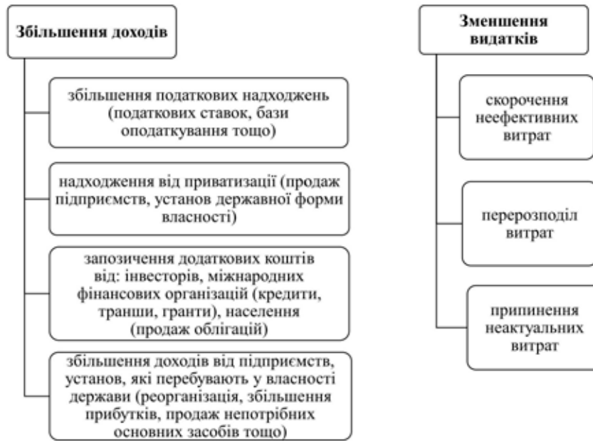
Рис. 1. Основні джерела формування фіскального простору

Основними джерелами розширення фіскального простору в Україні (тобто залучення ресурсів до бюджету) можуть бути скорочення витрат або збільшення доходів бюджету [9, с. 20] (рис. 1).