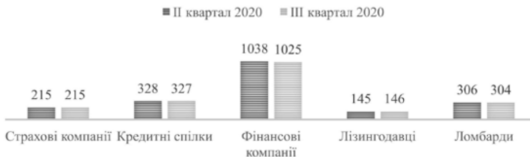
Рис. 2. Динаміка зміни кількості небанківських фінансових установ за період II кварталу 2020 — III кварталу 2020

гравців з ринку за власним бажанням. У III кварталі кількість страхових компаній не змінилася (рис. 2) і становить 215, з яких 20 займаються виключно страхуванням життя [5].